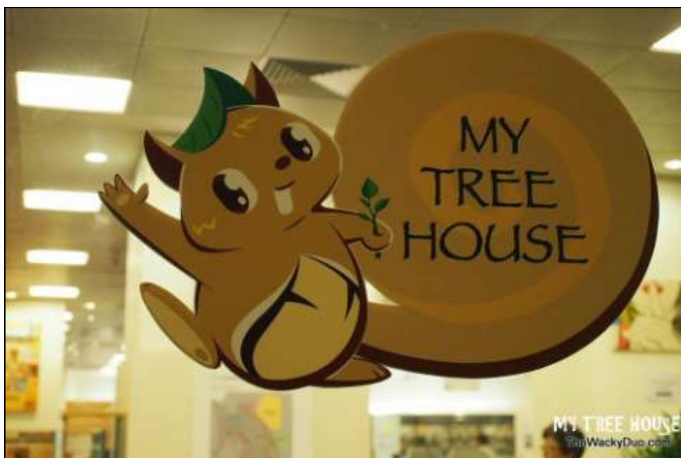
1. ábra A szingapúri gyermekkönyvtár logója

A 2013-as szingapúri IFLA kongresszuson augusztus 19-én négy előadás hangzott el a zöld könyvtár témakörrel kapcsolatban, aminek a keretében bemutatották a világ első zöld, Az én faházam (My Tree House) nevet viselő gyermekkönyvtárát is, amely a szingapúri nemzeti könyvtárban kapott helyet 11 (1., 2. ábra). A könyv jórészt a kongresszushoz kapcsolódóan The Green Library – Die grüne Bibliothek. The challenge of environmental sustainability – Ökologische Nachhaltigkeit in der Praxis címmel jelent meg, 12 és a fenntartható fejlődés korában a könyvtárak helyét és szerepét, zöld jellegük kialakításának módját vizsgálja – részben az IFLA kongresszuson is elhangzott előadások tükrében.