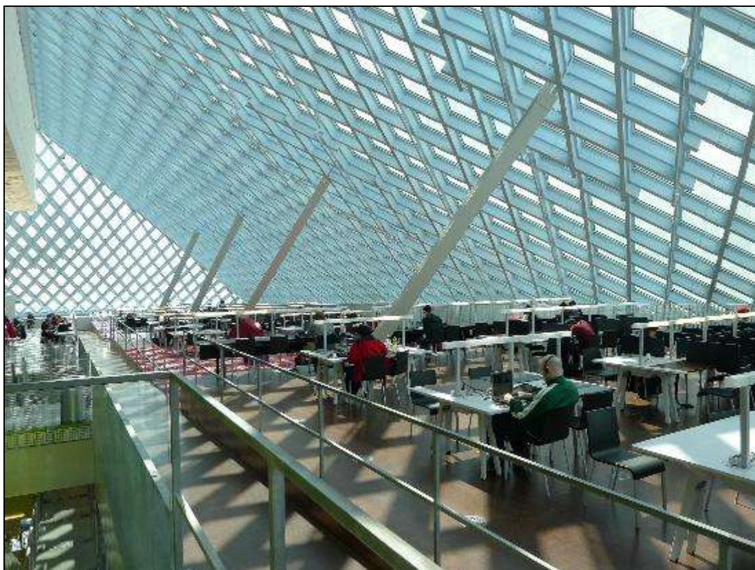
3. ábra A seattle-i könyvtár

ságát sugározzák magukból. 27 Többségük emellett szorosan kapcsolódik ahhoz az építészeti irányzathoz, amely a XX. század '80-as éveitől kezdett az építészeti formanyelvben megjeleníteni. Szabálytalan formákból, az épület olykor szándékos torzításából építkezik ez a stílus, ahol a tördelt, látszólag rendet nélkülöző vonalak éppúgy megtalálhatók, mint a lágy, ívelt formák, a folytonos külső felülettel határolt aerodinamikus tömegek (takete-baluba). 28 Az új forma azon kívül, hogy követi a modern építészeti stílusirányzatot, a könyvtárak átalakuló szerepéről árulkodik: a hagyományos szolgáltatások mellett újonnan megjelenő, pontosabban eredetileg is meglévő, de napjainkra felerősödő funkciókról. Manapság a könyvtár az információközvetítés és ismeretszerzés mellett élmények helyszíne, amely inspirálóan hat, és elősegíti a felhasználók különböző képességeinek kifejlődését, valamint az egyéni céllal érkezőknek közösséggé kovácsolódását.